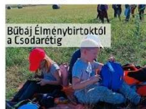
Bűbáj Élménybirtoktól a Csodaretig