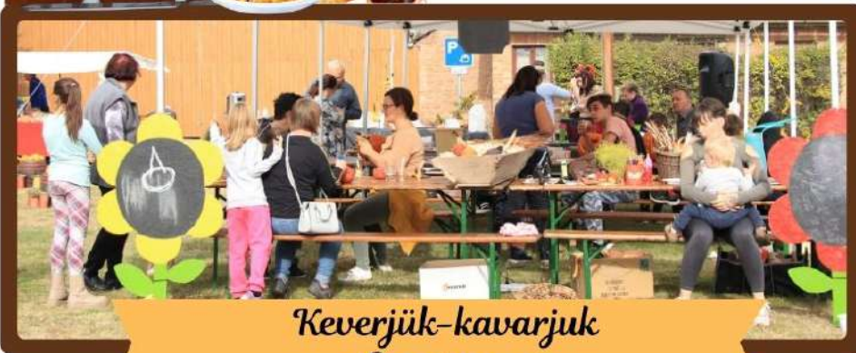
Keverjük-kavarjuk - Gasztronap