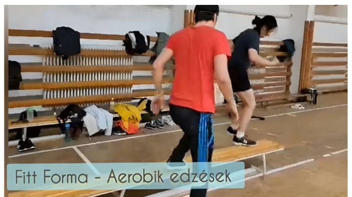
Fitt Forma - Aerobik edzések