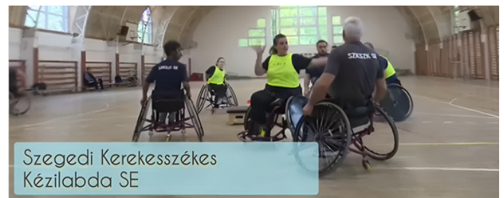
Szegedi Kerekesszékes Kézilabda SE