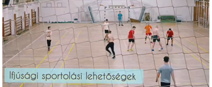
Ifjúsági sportolási lehetőségek

A hétfégek meg is teltek programmal, péntektől vasárnapig